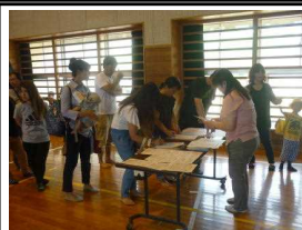
引き渡しカードの確認

本校においては、年間を通して計画的に諸訓練を実施し、危険回避能力の育成に努めているところです。日頃、知識として身に付けていることを訓練を通して体験することで両者が一つに統合され確かな力として定着し欲しいと願っています。災害時の対応については、ご家族で確認くださるようお願いいたします。