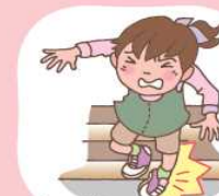
手や足をくじいた